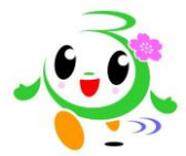
富津市 おもてなしキャラクター ふっつん

3月の組合定例議会で、平成26年度当初予算が審議・可決されました。 予算規模は、29億883万3千円で、対前年度比6.0%の減となりました。