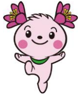
君津市 マスコットキャラクター きみびん