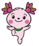
君津市 マスコットキャラクター きみぴん

3月の組合定例議会で、平成27年度当初予算が審議・可決されました。 予算規模は、23億8,919万2千円で、対前年度比17.9%の減となりました。