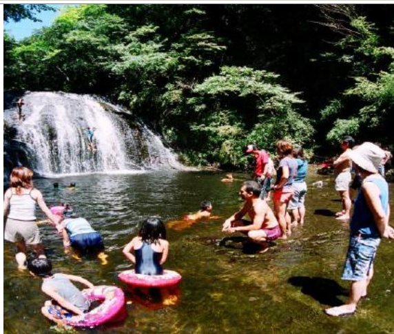
小糸川上流域の自然