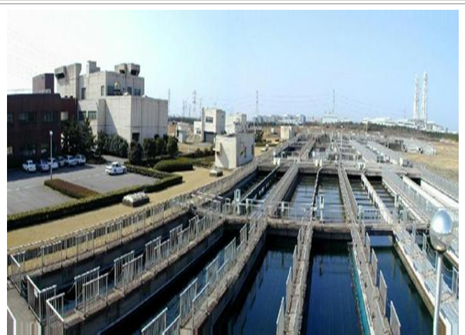
整備中の君津富津終末処理場